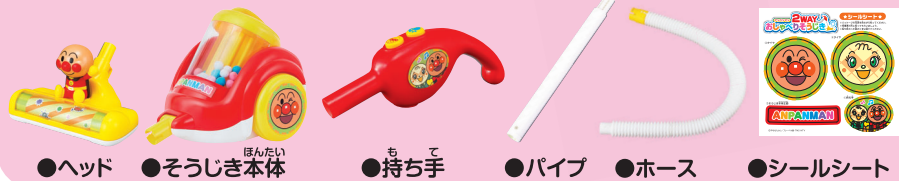
●ヘッド ●そうじき本体 ●持ち手 ●パイプ ●ホース ●シールシート