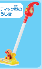
スティック型のそうじき