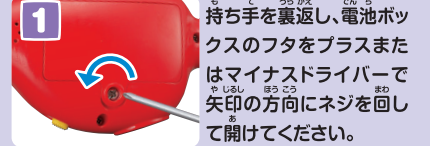
1 持ち手を裏返し、電池ボックスのフタをプラスまたはマイナスドライバーで矢印の方向にネジを回して開けてください。

※アルカリ単3乾電池2本使用(別売り) 電池の連続使用時間…アルカリ乾電池:約9時間